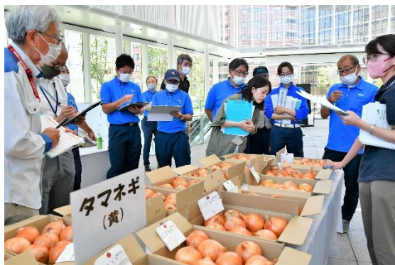
昨年の審査の様子

審査後は、一般来場者向けに出品物の展示や即売も実施。横浜市内産野菜の魅力を広く市民にPRします。