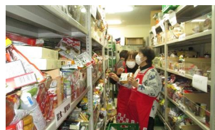
贈呈・研修・食品の仕分け体験の様子