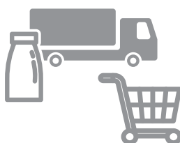
加工・流通・販売