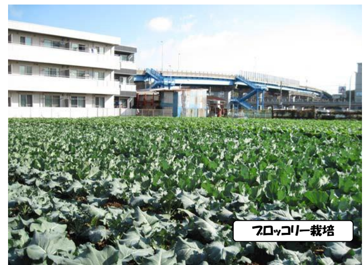
ブロッコリー栽培