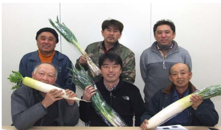
春まつりに向け野菜苗出荷の打ち合わせをするメンバー