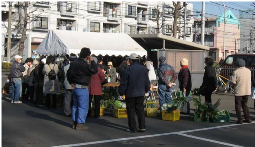
鶴見支店直売所の様子