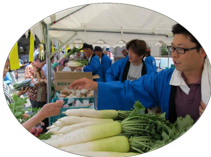
新鮮なお野菜いかがですか？