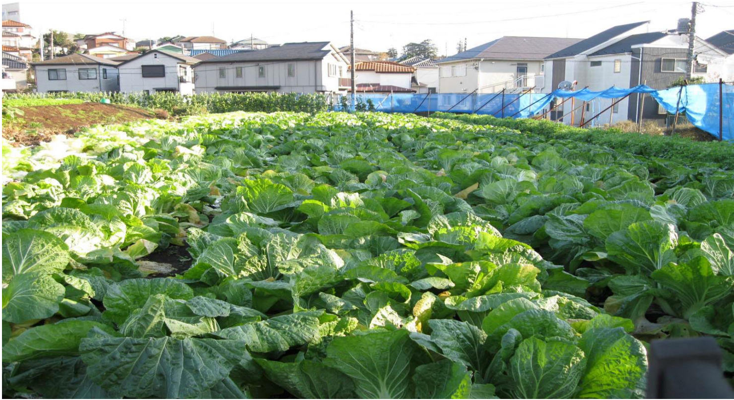
住宅地に囲まれた畑