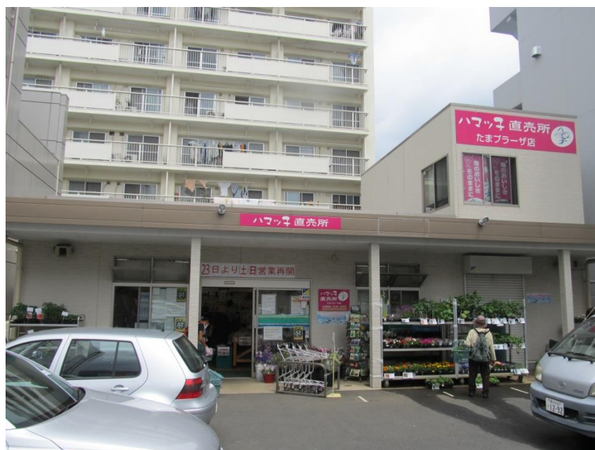
「ハマッ子」直売所 たまプラーザ店