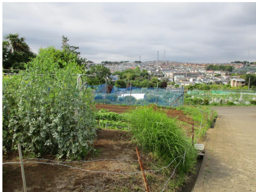
保木農業専用地区