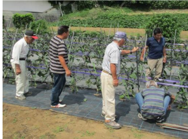
部員の圃場視察研修会