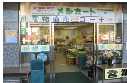
メルカートいそご店