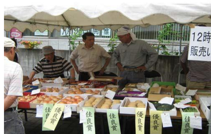
夏野菜持寄り品評会