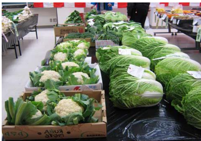
農業まつり農産物品評会